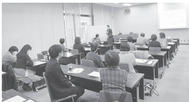
県民会館の会議室で昨年行われた公開講座

受講に際しては新型コロナウイルス感染防止対策にご協力お願いいたします。(マスク着用、手指消毒、検温等)