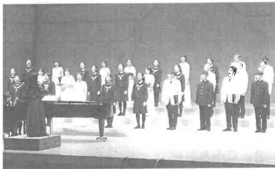
昨年のコンサートで熱演する音楽部員