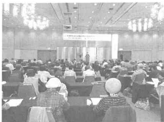
ふくしま大会に参加した全国からの相談員

ました。福島は酒処とあって20を超える銘柄の地酒も振る舞われ、飲み比べする人もいました。あるグループでは相談員の年齢が話題になり、86歳の女性相談員が元気に受信していることが報告されました。