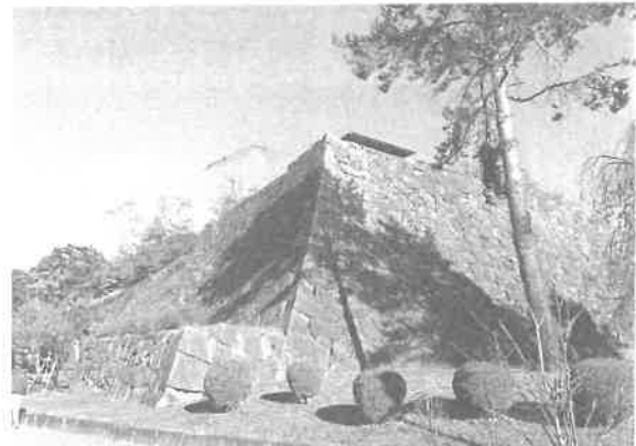
盛岡城跡公園(旧岩手公園)の石垣