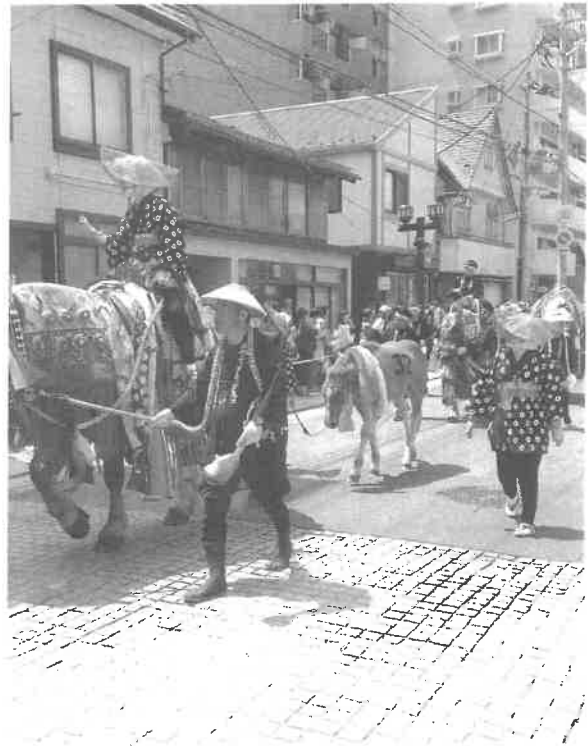
国民族無形文化財「チャグチャグ馬コ」。みちのくの初夏の風物詩で滝沢市から盛岡八幡宮まで14キロを鈴の音を鳴らし練り歩く

まず「公開講座」を受講します。申し込みは原則23歳以上で、性別、学歴、職業等は問いません。講義やロールプレイによる研修では、傾聴の仕方や人間関係基礎訓練などを習得し、認定を受けます。認定後も継続して研修します。ボランティアが不足しています。あなたも参加してみませんか。