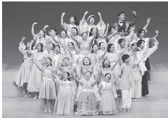
カラフルな衣装で盛り上げる音楽部員